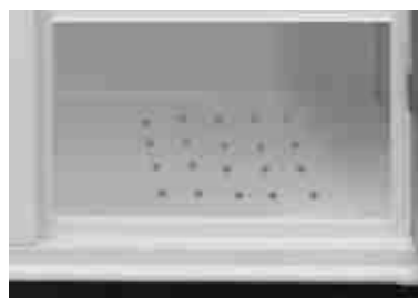
Vano inferiore porta scarpe con fondo zincato e areato