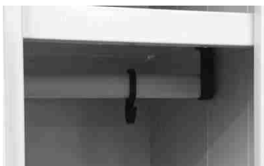
Appenderia interna in PVC