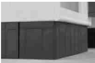
Zoccolo in polipropilene PP