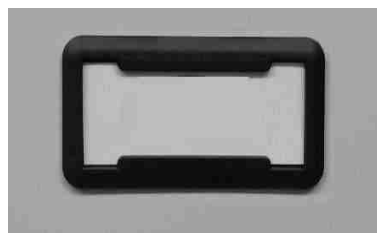
Porta cartellino in materiale plastico